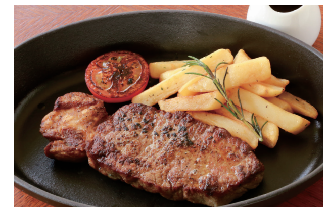
SIRLOIN STEAK (225G) 放牧牛のサーロインステーキ (225g)