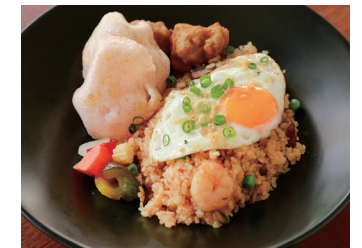
MILLY STYLE NASI GORENG ミリー特製 ナシゴレン