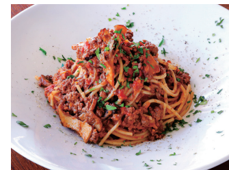
BOLOGNESE SPAGHETTI WITH MUSHROOM キノコ入りボロネーゼ スパゲッティ