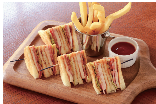
CLUB HOUSE SANDWICH クラブハウスサンドイッチ