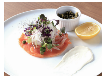
MARINATED SMOKED SALMON スモークサーモンのマリネ