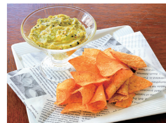
AVOCADO DIP & TORTILLA CHIPS アボカドディップ&トルティーヤチップス