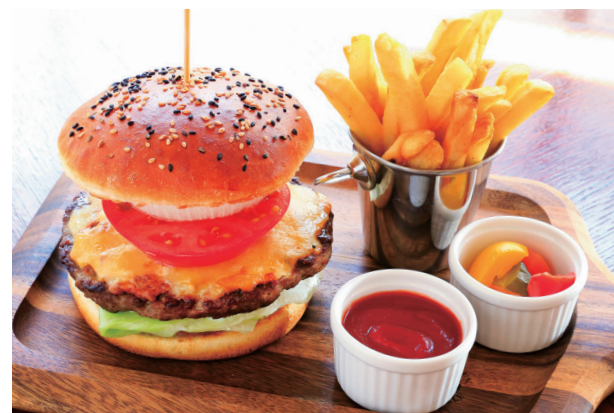
R. H. B. B. (ROSE HOTEL YOKOHAMA BEEF BURGER) R. H. B. B. (ローズホテル横浜ビーフバーガー)