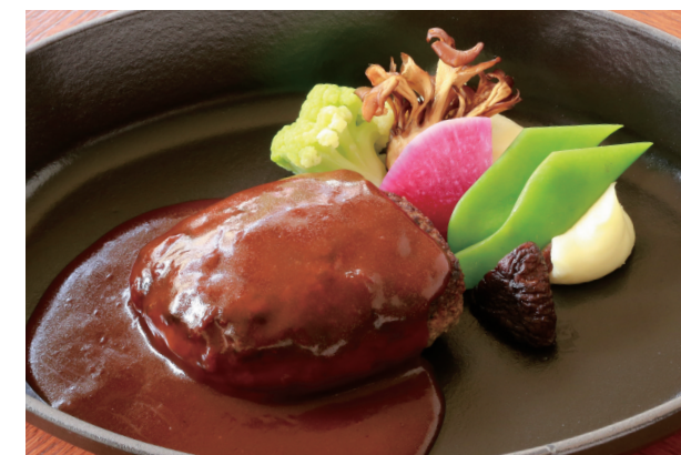
MILLY STYLE HAMBURG STEAK (200G) ミリー特製ハンバーグステーキ (200g)