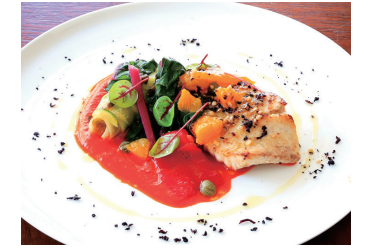
SAUTEED FISH OF THE DAY 本日鮮魚のソテー 本日の調理法で