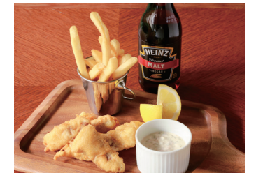
FISH & CHIPS WITH HOMEMADE TARTAR SAUCE フィッシュ&チップス 自家製タルタルソース