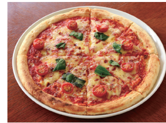
PIZZA MARGHERITA ピザ マルゲリータ