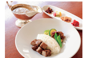
EUROPEAN BEEF CURRY WITH CUBED STEAK RICE サイコロステーキの欧風ビーフカレー