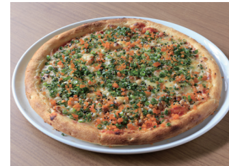
PIZZA WITH SAKURA SHRIMP AND SHIRASU AND MULLET ROE 桜エビとシラスとからすみのピザ