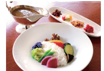
VEGETABLE COCONUT MILK CURRY ベジタブルココナッツミルクカレー