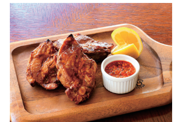
MATSUZAKA PORK BBQ SPARERIB IN ROMESCO SAUCE 松阪豚 BBQ スペアアリブ ロメスコソース