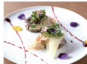
MARINATED JAPANESE SPANISH MACKAREL WITH CAULIFLOWER FUNGUS PICKLES AND ROSELLE SAUCE 鯖のマリネ花びら茸のグレッグ ハイビスカスロゼールのソース