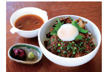
BEEF SIRLOIN STEAK OVER RICE (WITH SOUP) 牛サーロインステーキ丼 (スープ付)