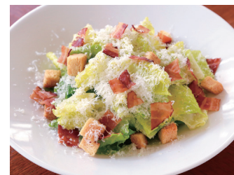
CAESAR SALAD シーザーサラダ