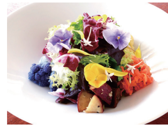
KANAGAWA VEGETABLES GARDEN SALAD 神奈川県契約農家のガーデンサラダ