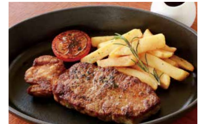
SIRLOIN STEAK (225G) 放牧牛のサーロインステーキ (225g)