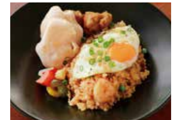
MILLY STYLE NASI GORENG ミリー特製 ナシゴレン