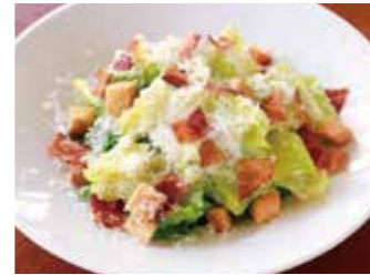
CAESAR SALAD シーザーサラダ