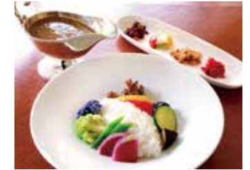
VEGETABLE COCONUT MILK CURRY ベジタブルココナッツミルクカレー