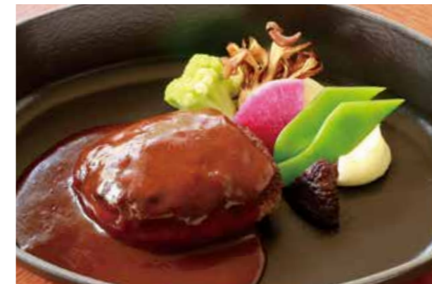
MILLY STYLE HAMBURG STEAK (200G) ミリー特製ハンバーグステーキ (200g)