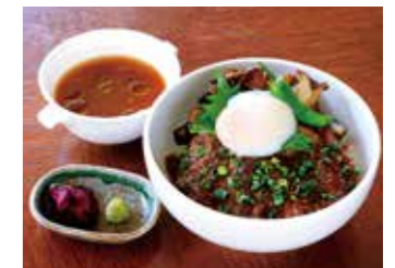
BEEF SIRLOIN STEAK OVER RICE ( WITH SOUP ) 牛サーロインステーキ丼 (スープ付)