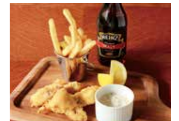
FISH & CHIPS WITH HOMEMADE TARTAR SAUCE フィッシュ&チップス 自家製タルタルソース