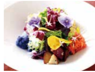
KANAGAWA VEGETABLES GARDEN SALAD 神奈川県契約農家のガーデンサラダ