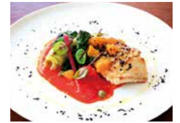
SAUTEED FISH OF THE DAY 本日鮮魚のソテー 本日の調理法で