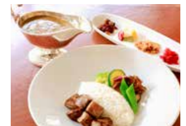
EUROPEAN BEEF CURRY WITH CUBED STEAK RICE サイコロステーキの欧風ビーフカレー