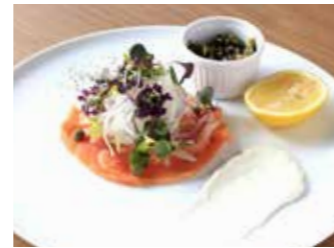
MARINATED SMOKED SALMON スモークサーモンのマリネ